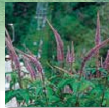
クガイソウ 開花6月下旬～7月