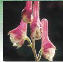
レイジンソウ 開花8月下旬～9月