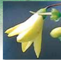
キレンゲショウマ 開花7月下旬～8月中旬