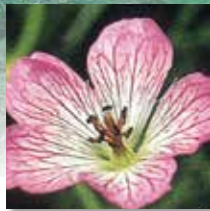
シコクフウ 開花7月～8月