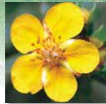
キンロバイ 開花6月～7月