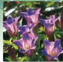
リンドウ 開花8月下旬～9月